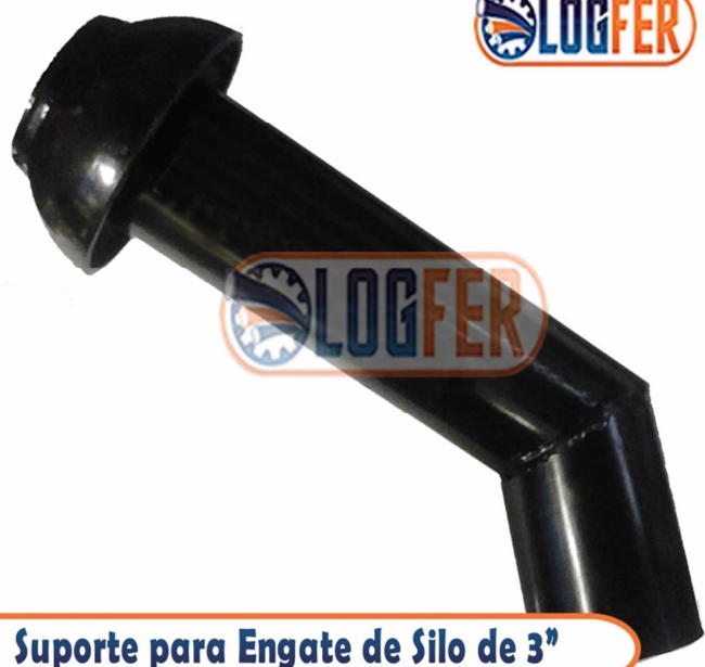
Suporte para Engate de Silo de 3"

Este suporte para engate é um tipo de terminal que é acoplado junto ao mangote e mangueira, para carga e descarga de tanque silo , e é fabricado exclusivamente no diâmetro de 3", para outros diâmetros solicitamos que nos consultem previamente para que possamos analisar. Estes tipos de engate rápido para silo também são conhecidos como terminais cardan perrot . O nosso Suporte para conector de silos dispensa o uso de ferramentas para acoplar e desacoplar.