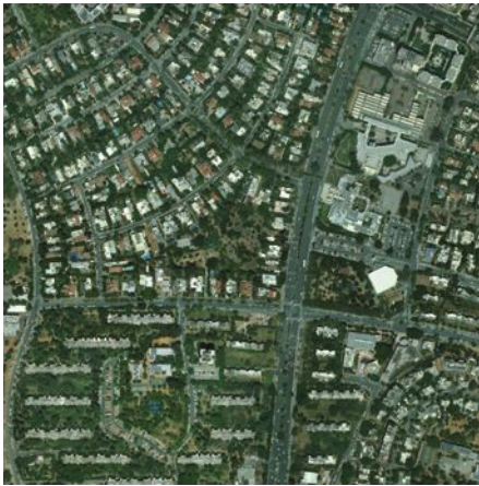
שיחוף במרחב (sharing land)