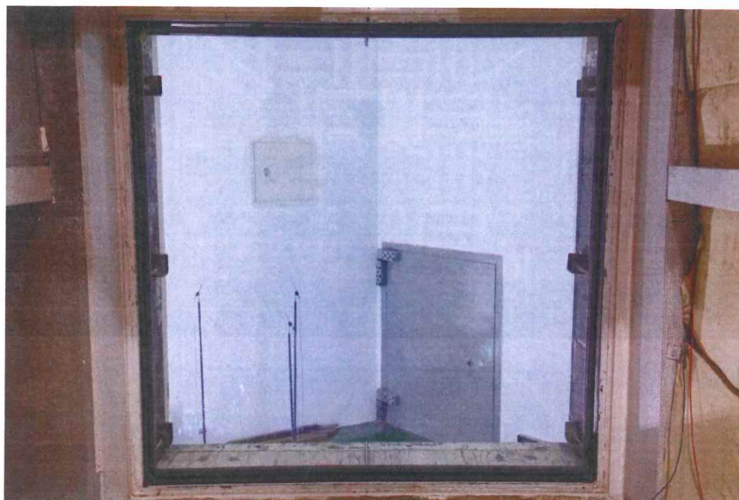
圖 1 試樣佈置圖 (無響室)